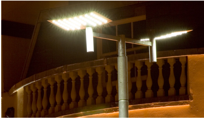
Insektenfreundliche LED-Lampen.

rum ab, aber emittieren ebenfalls nicht unterhalb von 400 nm. Sie sind damit für Insekten nur schwer wahrnehmbar. LED-Lampen haben zusätzlich noch den Vorteil, dass sie bei gleicher Leuchtkraft deutlich weniger Strom verbrauchen.