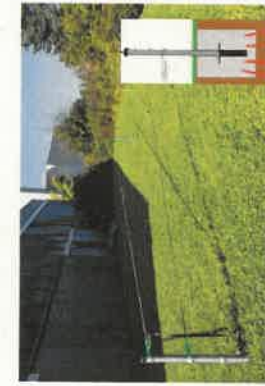
Standardformen Höhe 60 cm