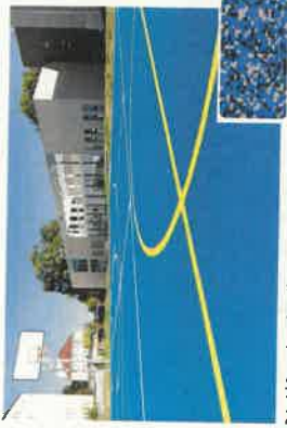
Beispiel Sportplatz: Grundfläche blau (Mischung: blau, weiß, grau) Beispiel