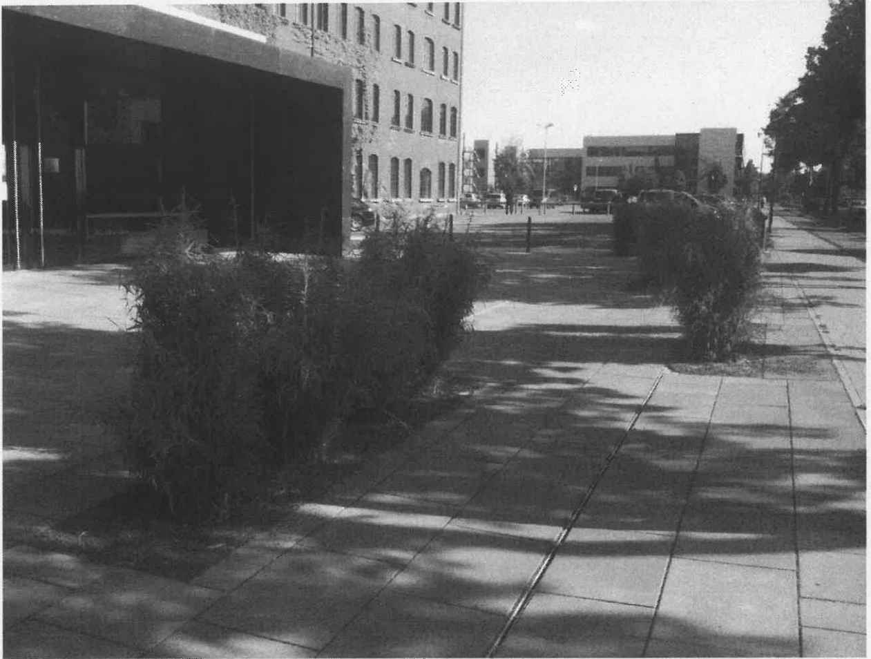
Vorplatz am Museumswinkel