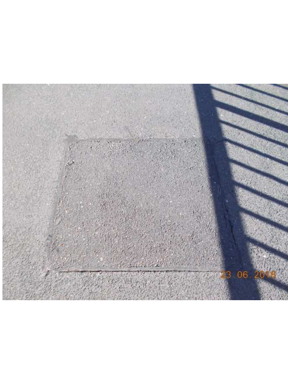
Schäden an Brückenbelag