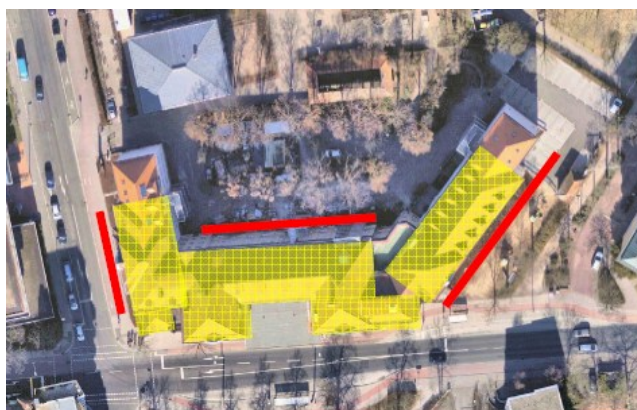
Abb. 4: Umfang der Fassaden- und Dachsanierung

Die Maßnahme kann bzw. soll aus wirtschaftlichen und bauablauftechnischen Gründen in einem Jahr abgewickelt werden. Die Eingriffe in den laufenden Schulbetrieb bedingt durch den Fensteraustausch werden mit dem Nutzer in bewährter Weise abgestimmt.