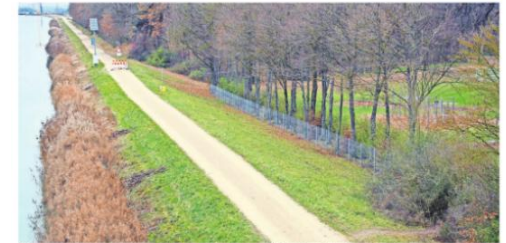
Ein gesamtanordnender Kanalweg können die Radfahrer direkt über einen Tempelfeld (Laternen) oder durch den Feld Bestand verlassen, um auf die Ordnungsgasse zu gelangen. Hier heißt es: Kanalweg.