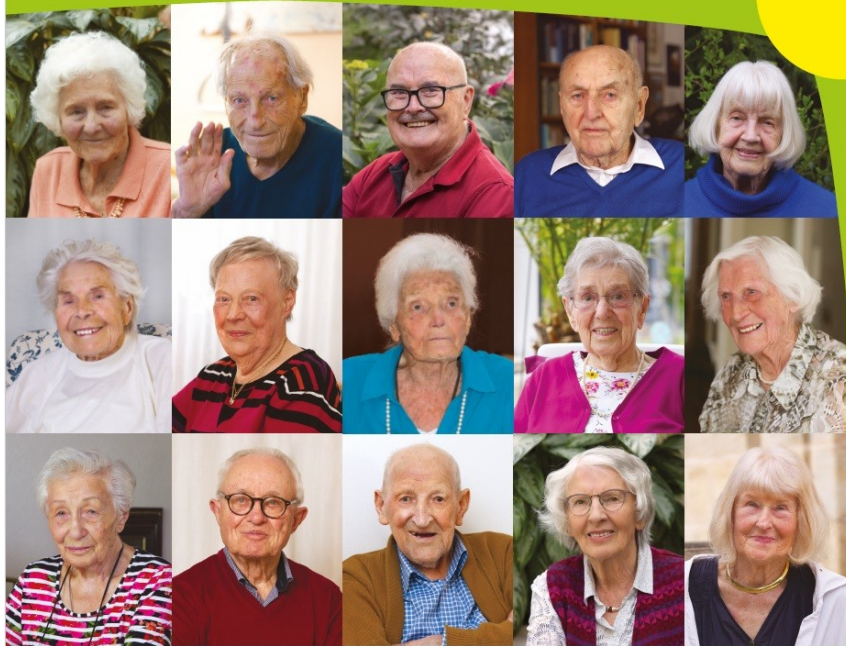
Titelbild der Ausstellungsbroschüre "Spitzensenioren"