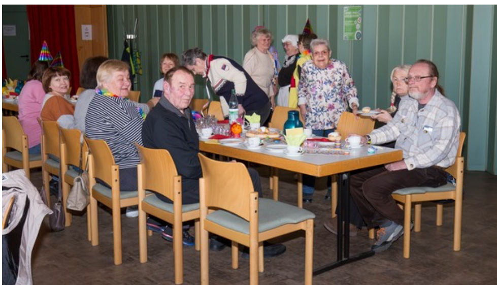
Fasching im Seniorencafé Ukraine