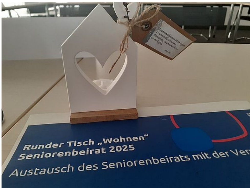
Runder Tisch Wohnen