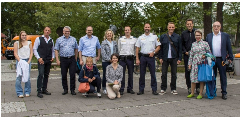
Senioren melden sich zu Wort auf Rädern

Danke an unsere Gäste und ihre Anregungen, an denen wir jetzt weiterarbeiten.