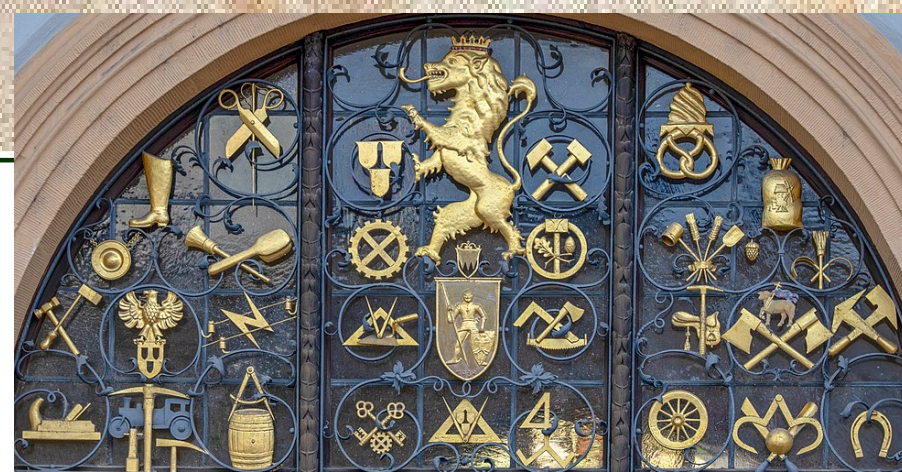
Zunftportal Bamberg ETA Hoffmann-Platz 4

die Bürger waren verpflichtet, nur bei zünftigen Handwerkern zu kaufen und arbeiten zu lassen.