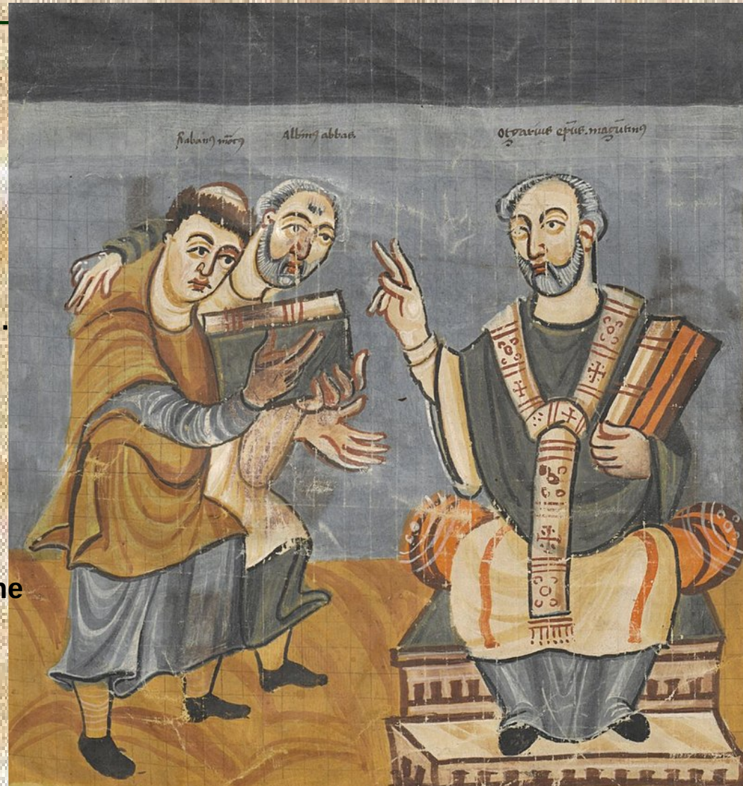
Von Fulda - Manuscript: Wien, Österreichische Nationalbibliothek, cod.652, fol. 2v (Fulda, 2nd quarter of the 9th century), Gemeinfrei