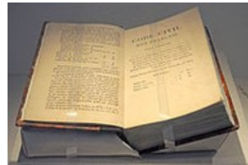
Code civile von 1807