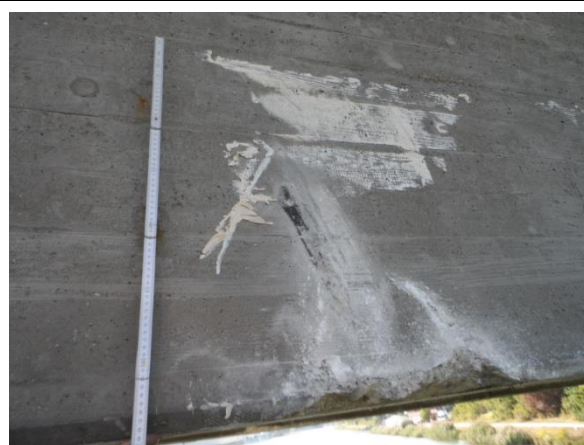
Betonschäden an der Untersicht der Straßenbrücke