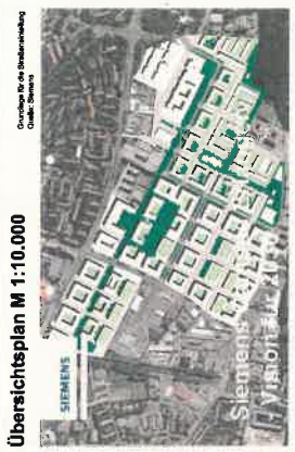
Übersichtsplan M 1:10.000