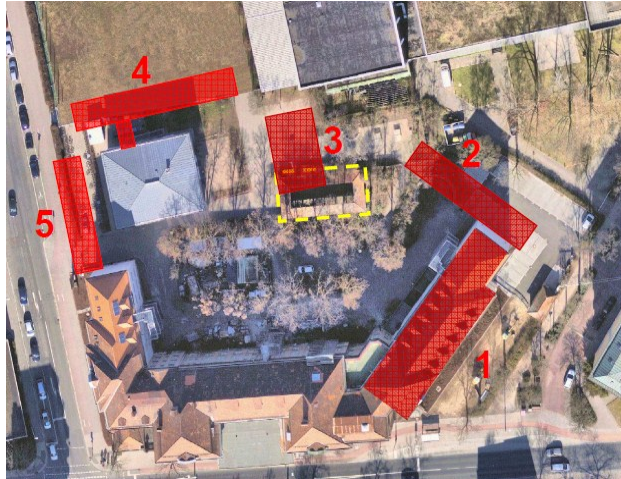
Abb. 1: Schulgelände CEG, Standortuntersuchungen Nr. 1 – Wiederausbau Dachgeschoss im Hauptgebäude Nr. 2 bis 5 – Neubauvarianten

Es wurden 4 verschiedene Standorte (Nr. 2 bis 5) für einen Neubau ermittelt und auf ihre Umsetzbarkeit geprüft (siehe Abb. 1).