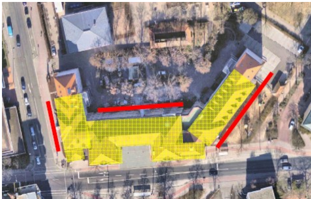
Abb. 4: Umfang der Fassaden- und Dachsanierung

Die Maßnahme kann bzw. soll aus wirtschaftlichen und bauablauftechnischen Gründen in einem Jahr abgewickelt werden. Die Eingriffe in den laufenden Schulbetrieb bedingt durch den Fensteraustausch werden mit dem Nutzer in bewährter Weise abgestimmt.