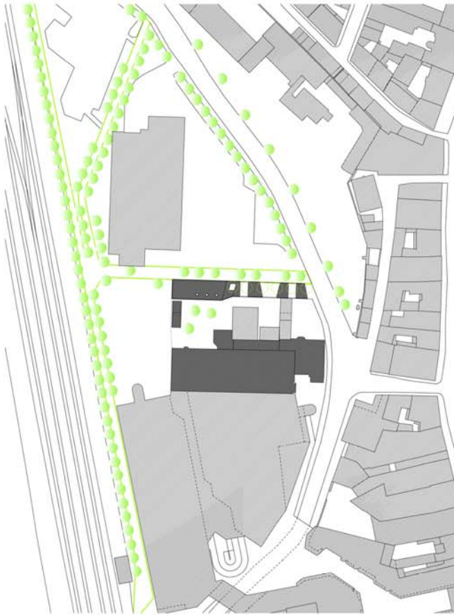
Lageplan M 1:1000