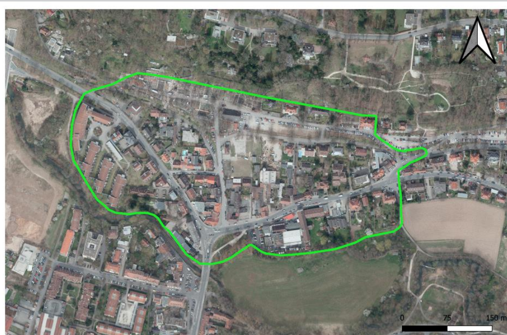
Räumlicher Umgriff Bewohnerparkgebiet "An den Kellern"