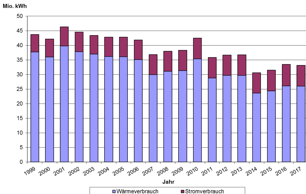
Entwicklung des Energieverbrauchs der städtischen Gebäude und Einrichtungen

1.3 Wasser: Nachdem 2016 zum Teil technisch bedingt ein relativ hoher Wasserverbrauch festzustellen war, ging dieser 2017 wieder deutlich zurück. Der Wasserverbrauch reduzierte sich gegenüber dem Vorjahr um 14,8 % von 87.815 m 3 auf 77.862 m 3 .