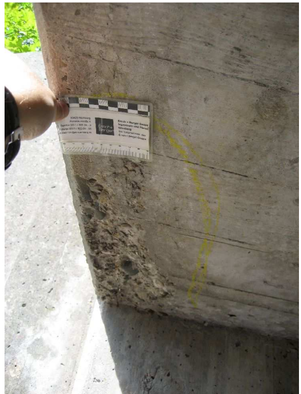
Weitere Betonschäden, meist mit freiliegender Bewehrung