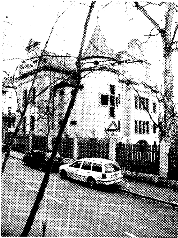
Aufnahme März 2001

Rathsberger Straße 20 - Corpshaus der Studentenverbindung Baruthia, repräsentativer Neurenaissancebau, 1903 von Hans Erlwein; mit Garteneinfassung und -einfahrt. Fl.Nr. 1223[Gemarkung Erlangen]