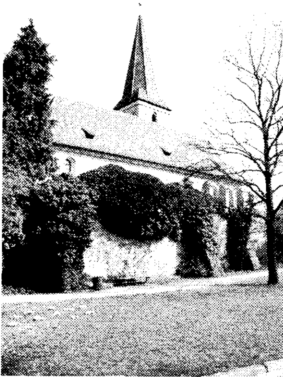
Ansicht von Süden Aufnahme April 2001

Kirchenweg - Kath. Pfarrkirche St. Sixtus, im Kern 14./15. Jh. Langhaus um 1550/50, erhöht 1723, erweitert 1937; mit Ausstattung; Kirchhofbefestigung, mittelalterlich, Ostmauer 1951 rekonstruiert; Sandsteinfigur St. Johann Nepomuk, bez. 1746; Martersäule, 18. Jh. Fl.Nr. 40[Gemarkung Büchenbach]