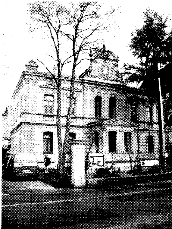
Aufnahme März 2001

Universitätsstraße 25 - Freimaurer-Logenhaus, Neurenaissance- Sandsteinquaderbau, 1890. Fl.Nr. 1103/5[Gemarkung Erlangen]