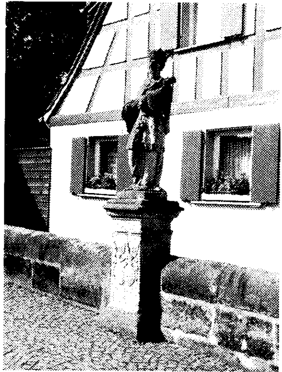
Steinfigur St. Johann Nepomuk